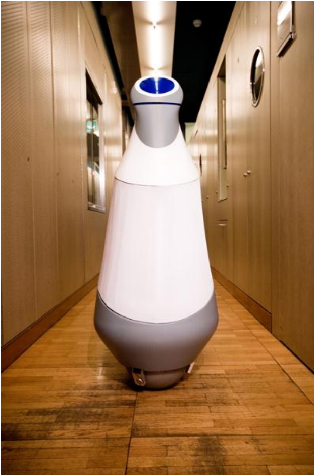
Abbildung 1: Rezero in Aktion

Ein interdisziplinäres Team von Studierenden hat auf beeindruckende Weise in die Realität umgesetzt, was sich auf Anhieb etwas gar verrückt anhört und eigentlich grundlegenden physikalischen Gesetzen zu widersprechen scheint. Ihr Ballbot „Rezero“ schafft nicht nur den Balanceakt auf der Kugel in höchster Vollendung, sondern besticht ebenso durch überzeugende technische Lösungen, beiseite Agilität und ästhetische Formgebung.