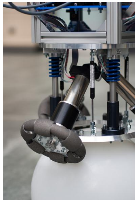
Abbildung 1: Antrieb: Motor EC-4pole 30, Planetengetriebe GP 42 C, Winkelencoder HEDL 5540, Omniwheel

Aufgebaut ist sie aus einem geometrisch hochpräzisen Aluminium-Hohlkörper und einer 4 mm dick gummierten, verschleissarmen Oberfläche, welche über einen sehr hohen Haftreibungskoeffizienten verfügt. Die exakte Kugelform und die hohe Reibkraft ermöglichen dabei hohe Laufruhe, äusserst dynamische Beschleunigungen und hohe Geschwindigkeiten von bis zu 3.5 m/s (knapp 13 km/h!). Nimmt man bekannte Ballbots als Referenz, zeigt sich, dass sich viele von ihnen oftmals etwas „unrund“ bewegen und eher durch Trägheit und Langsamkeit auffallen.