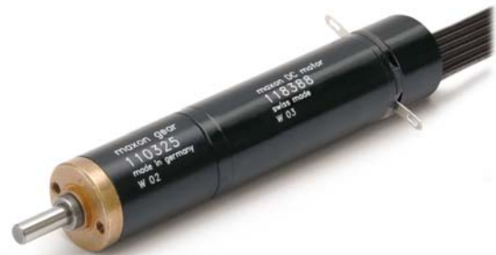
Abbildung 3: maxon RE-Motoren sind beliebte Antriebe in Robotik-Anwendungen

Skelett verteilt werden. Langfristig möchten die Wissenschaftler jedoch einen Humanoiden Roboter bauen, der wie ein Mensch auf zwei Beinen gehen und mit der Umwelt agieren kann. Die Beinpaare sind bereits konstruiert.